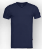
Real Navy 6040