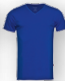
Royal Blue 6016